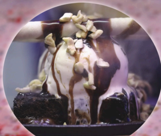
Sizzling Choco Brownie