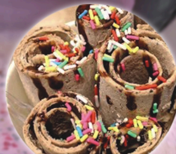
Roll Ice Creams