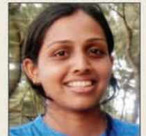
ಕು ಜೊನಿತಾ ರಸ್ಕಿನ್ಟಾ ಬಜ್ಜೋಡಿ ನಿಕೆಟ್‌ಪೂರ್ವ್ ಅಧ್ಯಕ್ಷಿಣ್