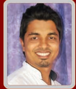
Vishwas Deanery Rep.

Director, President, Secretary, Office Bearers and all the youths of City Deanery