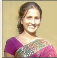
ಕು ನಿಶಿತಾ ಡಿಸೋಜ್ ಮಂಜೇಶ್ವರ್ ಲೇಖ್ ತಪಾಸ್ಸಾರ್