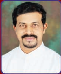
ಮಾ| ಬಾ| ಎಲಿಯಾಸ್ ಸೋಜ್ ನಿತ್ಯಾಧರ್ ನಗರ್