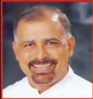
ಮೂಲ ಬಾಲಾ ಬಾಜಿಲ್ ವಾನ್