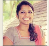
ಕು ರೋಶೆಲ್ ಮ್ಯುಸ್ಕರೇನಸ್ ಪುತ್ತೂರ್ ನೇಮಕ್ ಸಾಂದೊ