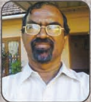
ಮಾ| ಬಾ| ವಿಕಟರ್ ಡಿ'ಸೋಜಿ ಕರ್ಯಾರ್