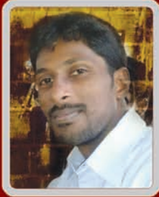
Arun Sports Secretary