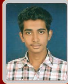
Merwin Cultural Secretary