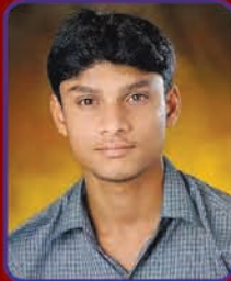
ಸ್ವಾನ್ತಿ ಮೊಂತೆರೋ ಪಾನೀರ್