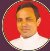
ದಿರೆಕ್ಟಾರ್ : ಮಾಂ ಬಾಂ ಎಡ್ವಿನ್ ಕೊರೆಯಾ